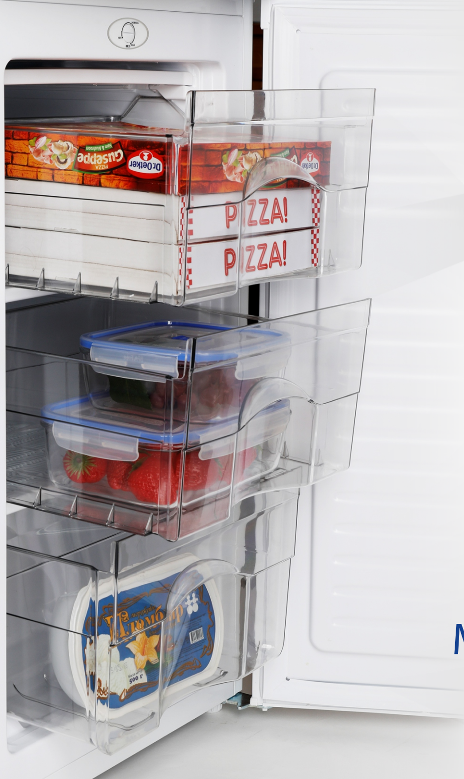
Table-Top МОРОЗИЛЬНИК M-7402-100