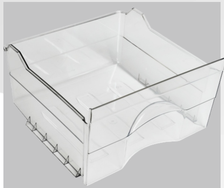
ВЫДВИЖНЫЕ КОРЗИНЫ (2 ШТ ВЕРХНИЕ)