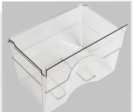
ВЫДВИЖНАЯ КОРЗИНА (1 ШТ НИЖНЯЯ)