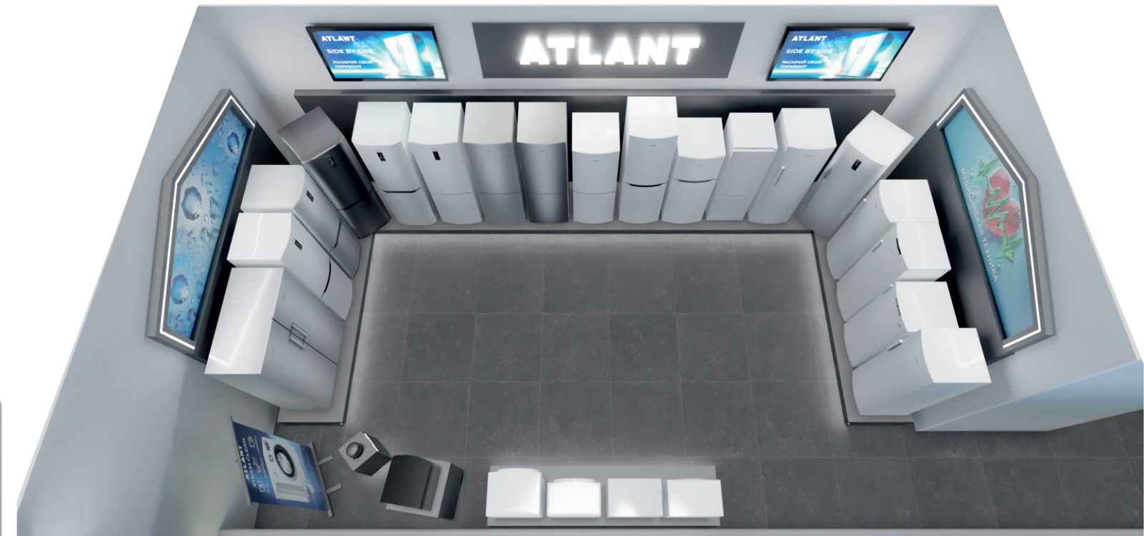
Вид сверху 2