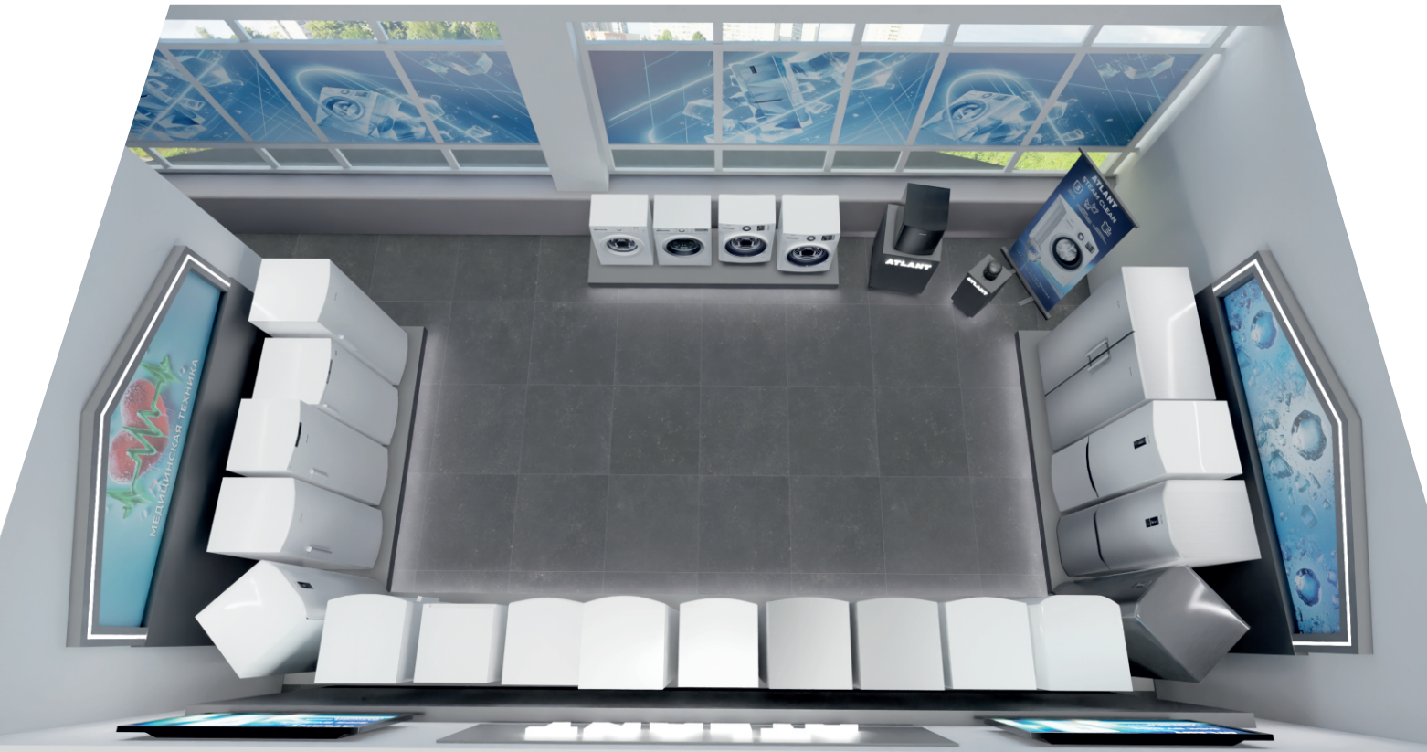
Вид сверху 1