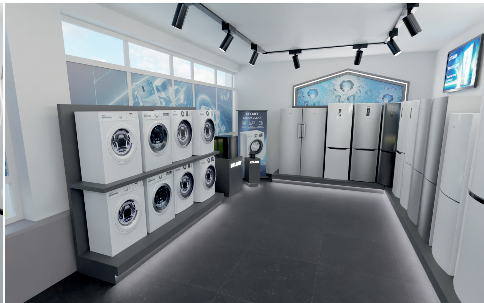
Пример оклейки окна